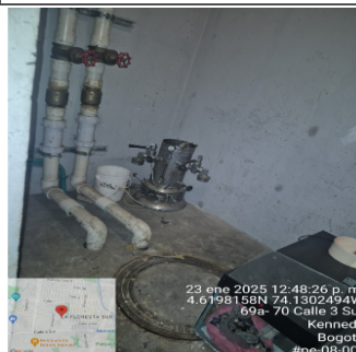
Foto No. 5 Estado actual pe-08-0001