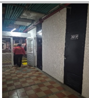
Foto No. 4 Cuarto de bombas No. 1