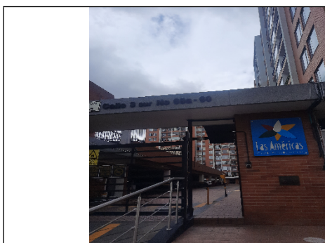
Foto No. 1 Fachada y nomenclatura del predio

El día 23 de enero del 2025 se realizó visita de control en el Calle 3 Sur No. 69 A – 60 lugar donde se ubica el CONJUNTO AMÉRICAS CLUB RESIDENCIAL ETAPA 1 – PROPIEDAD HORIZONTAL (Foto No. 1 y 2), con el fin de verificar las condiciones físicas y ambientales de los pozos identificados ante la Entidad con códigos pe-08-0001 y pe-08-0002.